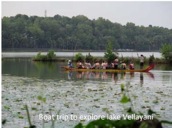
Boat trip to explore lake Vellayani